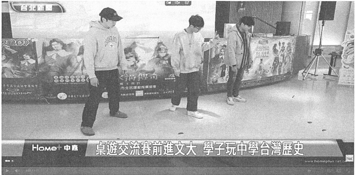
桌遊交流賽前進文大 學子玩中學台灣歷史